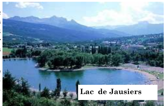
Lac de Jausiers