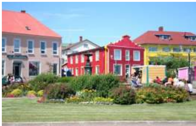
La petite France d'Amérique du Nord

Au XVIème siècle, Jacques Cartier arriva dans l'actuel Canada ( le Québec ). C'était le début de la présence Française en Amérique du Nord, avec la fondation des villes de Montréal et de Québec.